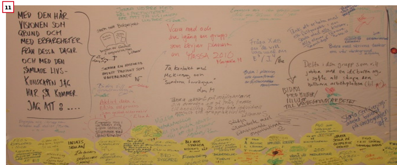
Text: Lillemor Frenkel, Directa foto: Ulric och Lillemor