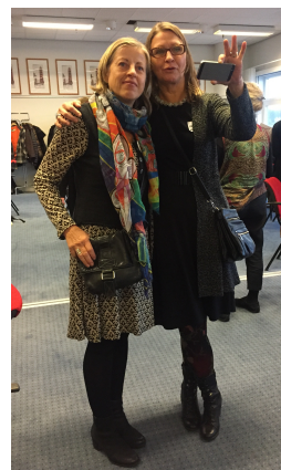
Många selfies blev det på mötet..