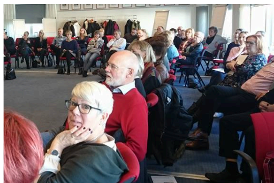
Drygt 90 gestaltare samlades på Ariadne.