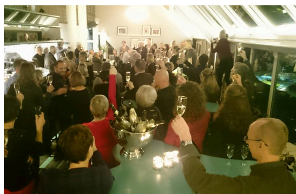
På lördag kväll firade Gestalt i Sverige 40 år med middag, sånger och dans till GRB, Gestalt Rockband!