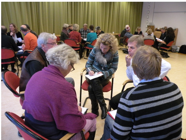
Samtal om gestaltbegrepp

Dag två inleddes med den tredje och sista omgången workshops. Därefter var det samling i storgrupp och återkoppling till väggtidningen och grundbegreppen. Sedan självorganisering i mindre grupper kring något av grundbegreppen utifrån behov och lust att samtala vidare och dela erfarenheter från egna uppdrag eller chefsarbete.