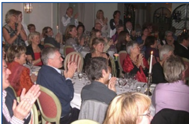
Festmiddag i sann gestaltisk anda med bejublade framträdanden!

Sen var det dag för "Middagsuppdraget". Vår tradition att gestalta mötets tema under middagen planerades på ett kreativt sätt i de olika grupperna. Vissa valde baren som mötesplats. Hur bra är vi gestaltare på egen konflikt hantering egentligen? Vi bjöds på spontana och träffsäkra framträdanden kring våra egna konfliktteman. Här gestaltades allt från mamma – barn konflikter till större systemkonflikter som t ex att öppna upp FGO för andra medlemsgrupper eller ej.