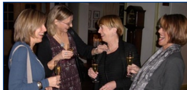
Nya FGO medlemmar från O18 och O19 i glada vänners lag!